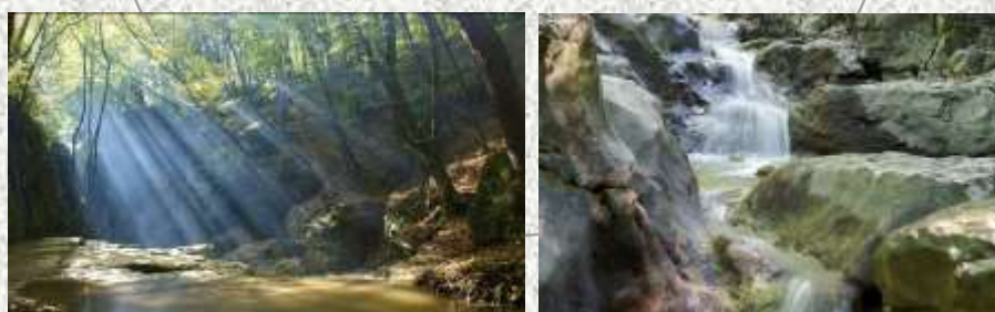
Bakonynána Római fürdő