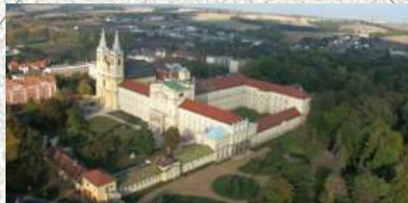
zirci Ciszterci Apátság Látogatóközpontja