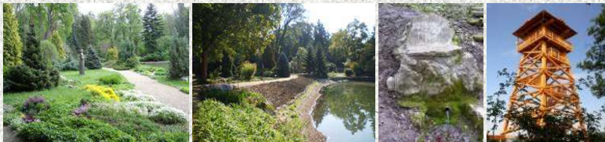
Zirc arborétum és forrás és a Fekete István kilátó Hárskútnál